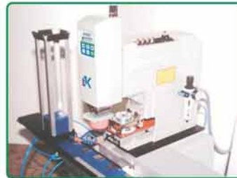
- 自动化生产线系统