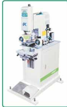
- 独立单色机 (连清洁胶头系统)