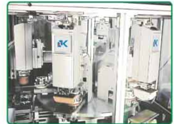
- 转盘连动机 (6-8台)