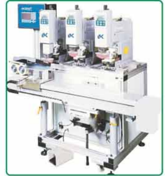
- 生产线上连动式Alien机