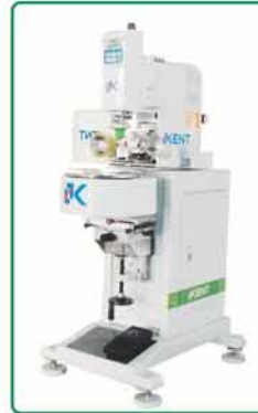
- 独立机箱配2位 气动圆转盘