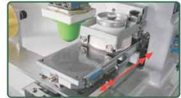
油杯平台前后推送运作 (自动清洁胶头收藏底部设计)